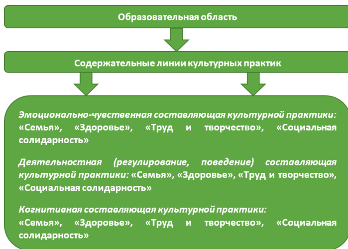
Рис. 2. Модель реализации содержания образовательной области